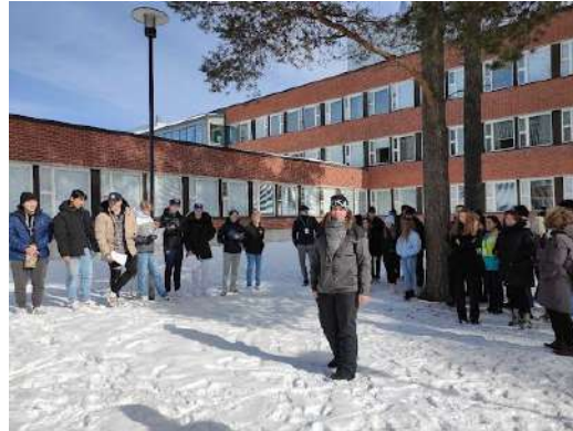
Presentación del grupo y cohesión de todos los grupos (Finlandia, Dinamarca, Italia, Países Bajos y España)