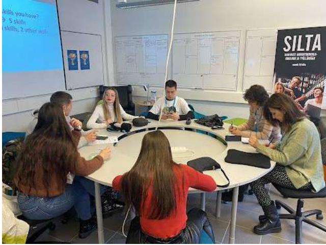
Preparando la SKILL COMPETITION