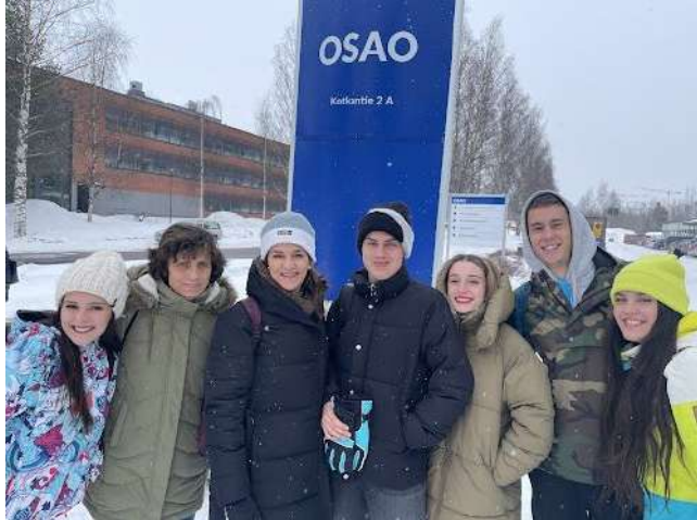
Llegada a OSAO